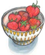
250 g Erdbeeren