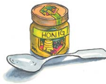
2 Esslöffel Honig